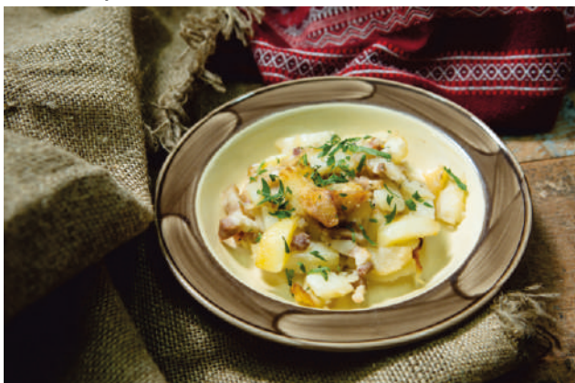
Рис с овощами