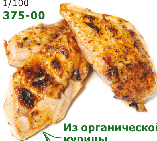
Из органической курицы