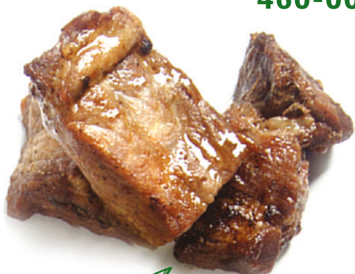
Свинина (мякоть шея)